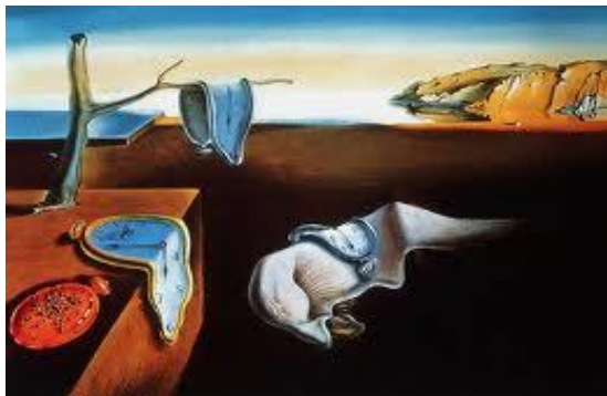
Obra: A persistência da memória – Salvador Dali (1931)

PASTORAL: "VIGIAR, PRESERVAR E COLHER OS FRUTOS."